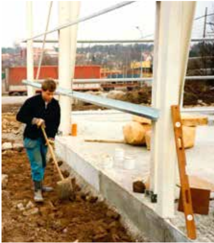
Nytt kontor/kontorsbyggnad påbörjas 1991.

Debiteringssystemet datoriseras. Energipriset är 23,8 öre/kWh.