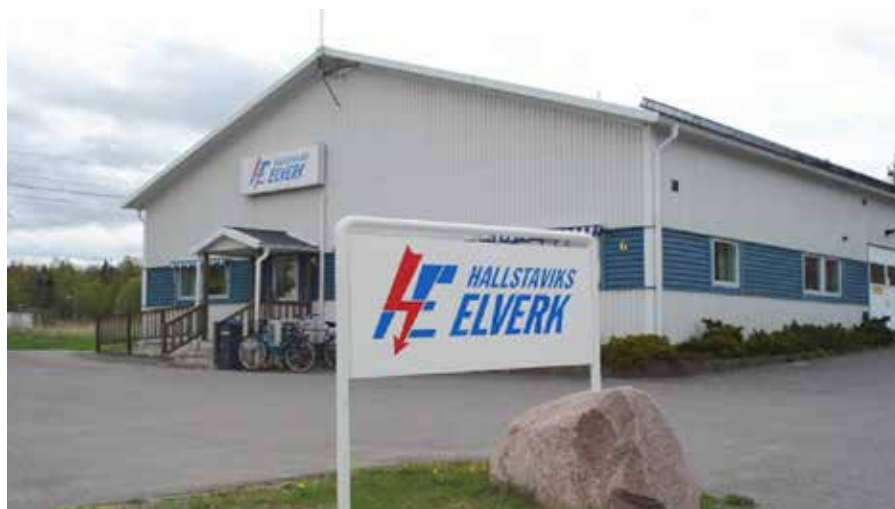
Nya kontoret/kontorsbyggnaden tas i bruk den 17 augusti 1992.