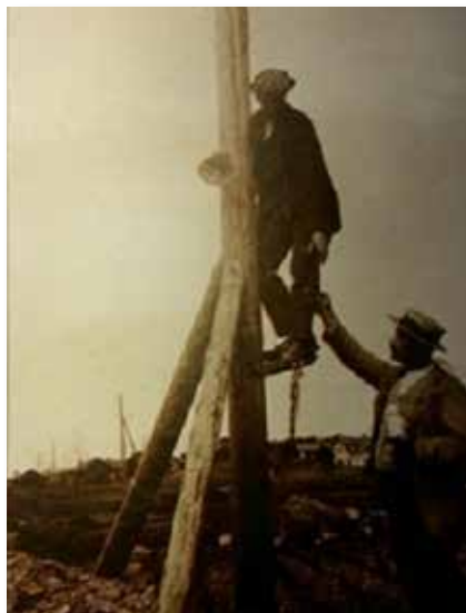
Ernfrid & Johan Hallén reser stolpinje på 1920-talet.