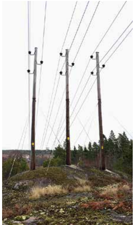
1979 antas en långsiktig plan för att tekniskt förstärka elnätet och på sikt få ned all högspänningsöverföring i mark.

Kontoret flyttar till fastigheten Eliseborg, Carl Wahrens väg 38.